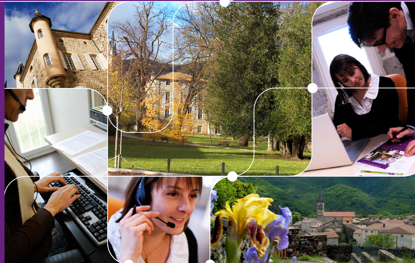
nouvelIR 04 75 94 04 60 - - Janv. 12.

Mairie - Place du Champ de Mars - 07330 THUEYTS Tél. 04 75 36 41 08 - Fax 04 75 36 46 51 contact@valtech-chateaublou.fr - www.valtech-chateaublou.fr